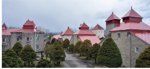
ニッカウヰスキー余市蒸留所