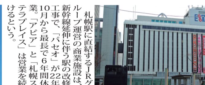
来年夏には閉館する「札幌エスタ」

JR北のグループ会社「札幌駅総合開発」(北海道倶楽部会員)が運営、エスタ終了により、JR北の家賃収入は年間約9億円の減少になる見込みだ。新ビルは隣接する西1街区との一体開発を予定、JR札幌エスタは1978年に開業した。地上11階、地下3階建て、延べ床面積は8万6500平方メートル。現在は家電量販店のビックカメラや、ラ札幌店を核テナントとし、21年3月末時点で飲食店など114店舗が入居している。