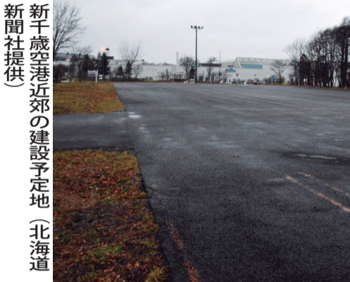
新千歳空港近郊の建設予定地

洋酒のジン製造する「北海道自由ウイスキー」(札幌)の経営者らが昨年6月、酒造会社を立ち上げた。ウイスキーと日本酒を1カ所で造る、道内初の施設を新千歳空港周辺に建設する。2023年秋の操業を目指し、稼働から5年間で年間10万人の集客と12億円の売り上げが目標だ。