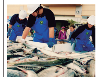
釧路市産の新鮮な魚介類