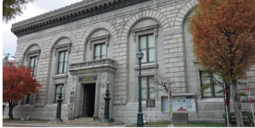
旧三井銀行小樽支店(同)

国の文化審議会は、「ニッカウヰスキー余市蒸留所施設」(後志管内余市町)と「旧三井銀行小樽支店本館、附属家」を含む10件を、重要文化財(重文)に指定登録するよう、末松信介文部科学相に答申した。両施設は、歴史的価値だけでなく観光客からの人気も高く、鈴木直道知事は「関係者の適切な保存活動、次世代へ継承するという強い意志が実を結んだ」と歓迎した。