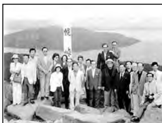
北星会 北見・網走ゴルフツアーの一行 昭和51年8月美幌峠で