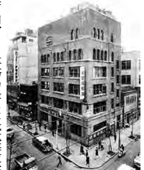
仮事務局が置かれた 東京・銀座の 北海道新聞旧社屋