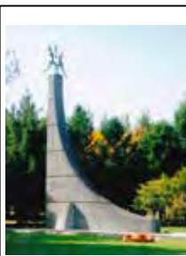
立碑記念 場に 競技 内輪 真駒 も内 今札幌 つ舞う 「舞う少女」