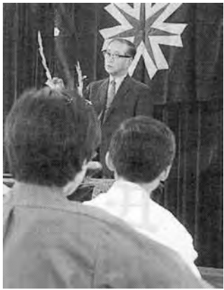
上京した若者たちの歓迎会で挨拶する町村道知事