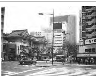
「辨松ビル」があった 東京・銀座の歌舞伎座界隈

その後猛インフレで、価格が数倍になったこの建物を「原価」で「買収する権利」を道庁に譲ったことで、