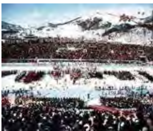
札幌冬季オリンピック開会式 倶楽部も貢献

戦後から復興期に、倶楽部が道庁や開発庁にも、今の常識では考えられない援助をし、そしてふるさと北海道の発展に倶楽部が尽力していた当時を見聞し、多くの事業に参画した私にとって、先人の偉業を記録に残すことができたことは大変嬉しく、関係者に心から感謝し、お礼を申し上げる次第です。