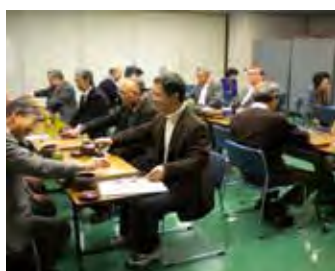
大会開かれる四年

「北星会」については、本稿第七回で発足のきっかけや、佐藤榮作さんから総理大臣杯の寄贈を受けたエピソード等を書きました。昭和