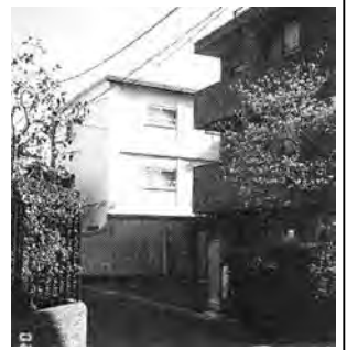
現在の北海道開発庁（現総務庁）職員宿舎（左側）

業にしてはどうかという提案があったのですが、一部の反対があったため、やむをえず有志が手掛けたのです。後に北海道在京学生後援会が、練馬区上石神井に八百坪の土地を取得し、北海道学生寮が建設されました。最近、鉄筋コンクリート造り、七十七の個室を持つ建物に改装され、現在に至っています。